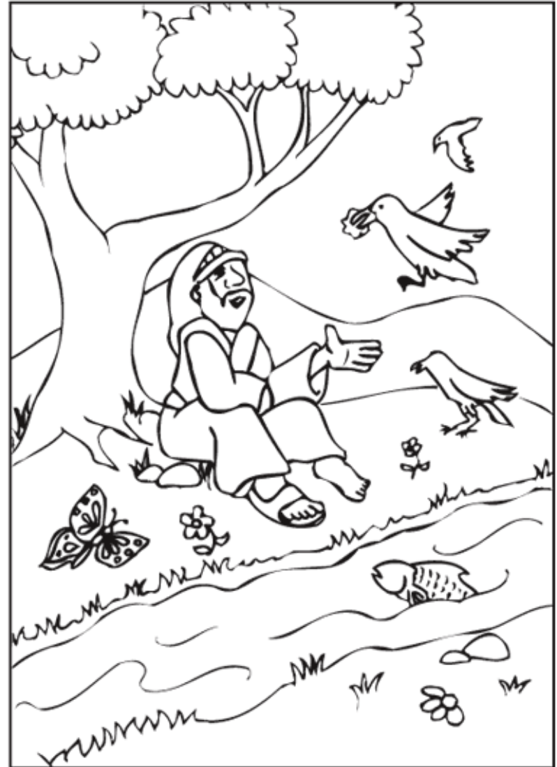
Elijah is Fed by the Ravens

During a period of drought, wild birds and ravens brought food for the prophet Elijah. Can't you find what is missing in this picture of Elijah and the ravens? There are nine missing items.